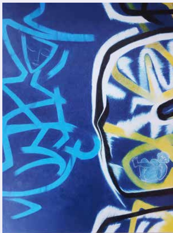
Doorlie Gerdes, Apocalyptische kosmische graffiti met daarin de Blauwe Madonna , kleurpotlood op papier, 2003